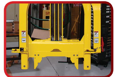
带定制底座的管锯用于切割钢制工字梁, 其他特殊型号请咨询获取