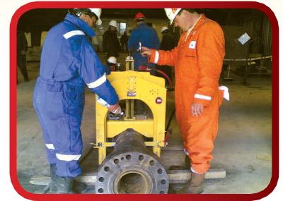
闸刀式管锯操作简单、快速, 可切割大多数材料